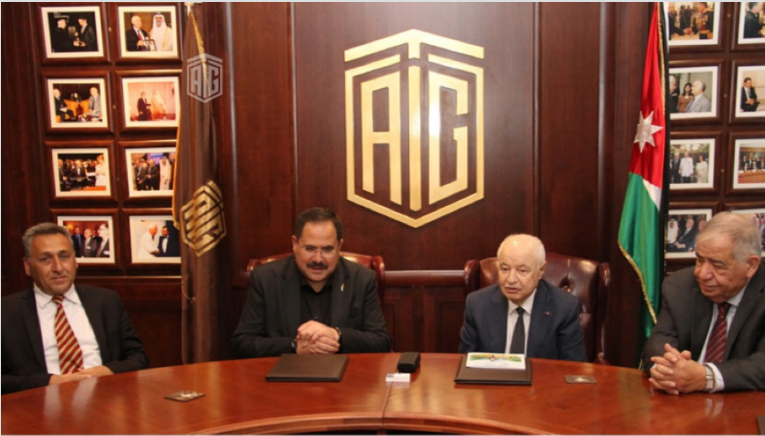
إنشاء كلية طلال أبوغزاله للابتكار بجامعة فلسطين